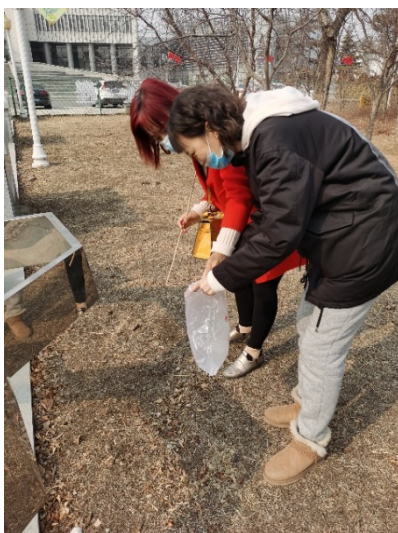
党员志愿者捡拾垃圾缩影二