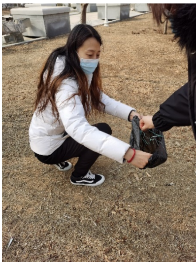
党员志愿者捡拾垃圾缩影一