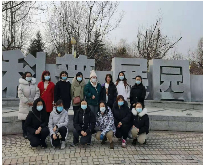
开发区校区图书馆职工游科普展园