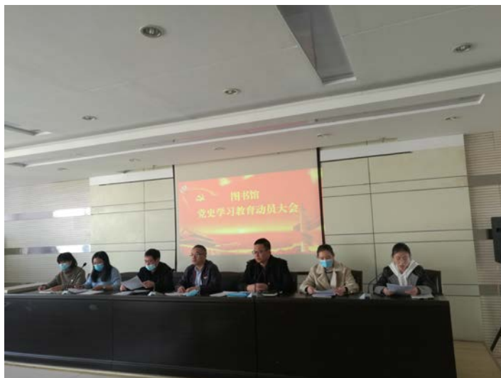
图书馆党总支成员