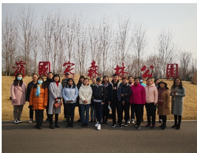
秦皇岛校区图书馆职工游海滨森林公园

为迎接第 111 个“三八妇女节”的到来，体现党对妇女工作的高度重视、关爱和尊重，依据校工会相关文件通知精神，图书馆工会于 2021 年 3 月 8 日下午 2 点，在三校区组织了以“科师大家庭、巾帼展风采”为主题的休闲郊游活动。此次郊游是新冠疫情以来图书馆职工首次室外活动，大家共赏春景，相互祝福，畅谈喜乐事，并合影留念，欢快心情溢于言表。此次活动展示了女馆员健康、文明、快乐的精神风貌，丰富了馆员的业余生活，增强了馆员之间的交流与凝聚力。