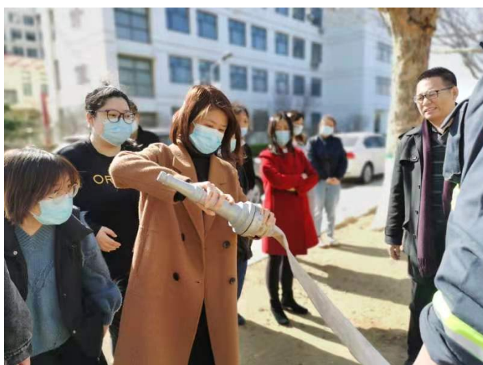
馆员实操消防水枪的安装方法