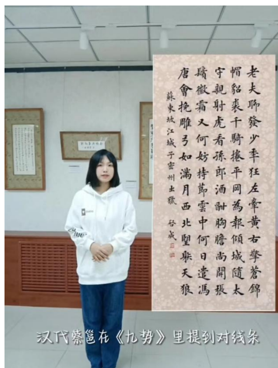
参赛选手讲解书法作品

比赛通过讲解员拍视频的形式，将参赛视频发在讲解员群，由老师和所有参赛选手共同打分，评选出一二三等奖和优秀奖若干名。全体书法馆讲解员参加了本次比赛，比赛提高了讲解员们对馆内作品的领悟力，精进了讲解水平，为传播中华优秀传统文化打下了良好基础。