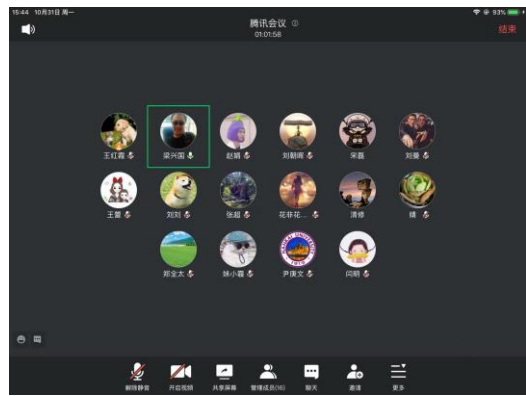
秦皇岛校区党支部学习人员截图