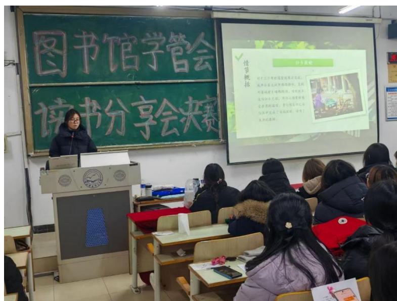
昌黎校区读书分享会决赛现场

现场氛围热烈融洽，分享间隙穿插趣味互动游戏与中场歌曲，在紧张的交流之余增添轻松氛围，让参与者在沉浸式体验中收获快乐与感悟。此次分享会不仅为学子搭建了交流思想、展示自我的平台，促进学子在分享中深化理解、提升表达，生动践行了“以文化人、以文育人”的校园文化建设理念。