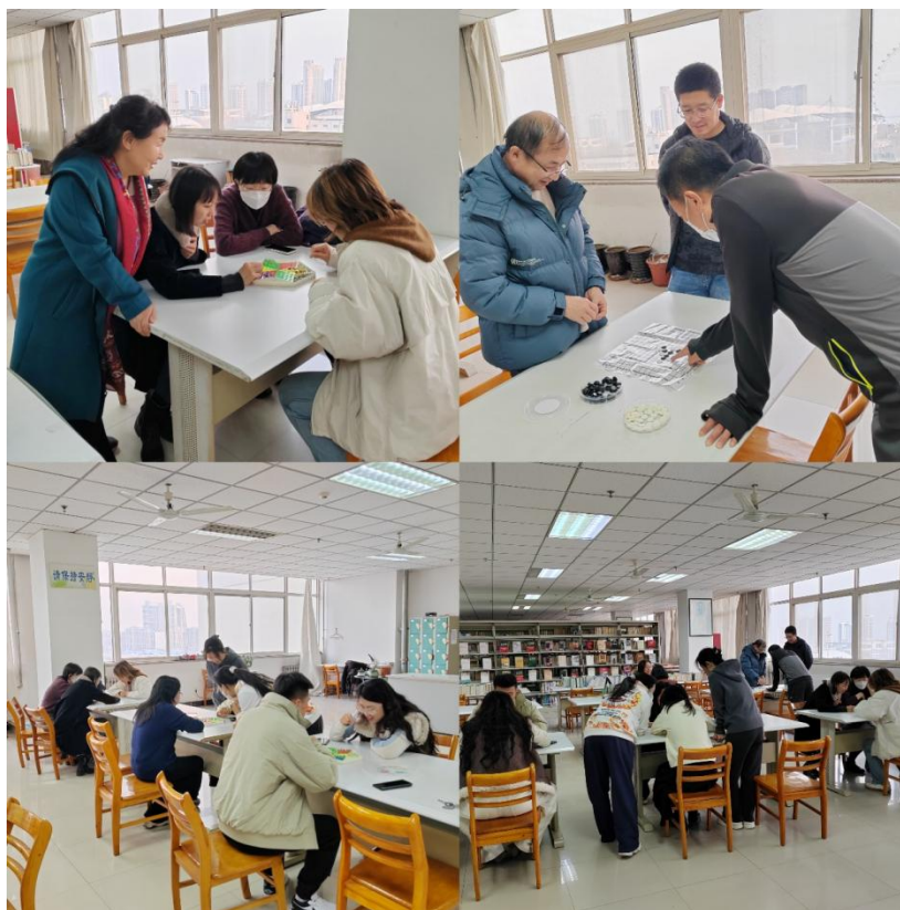
秦皇岛校区棋艺大比拼活动照片