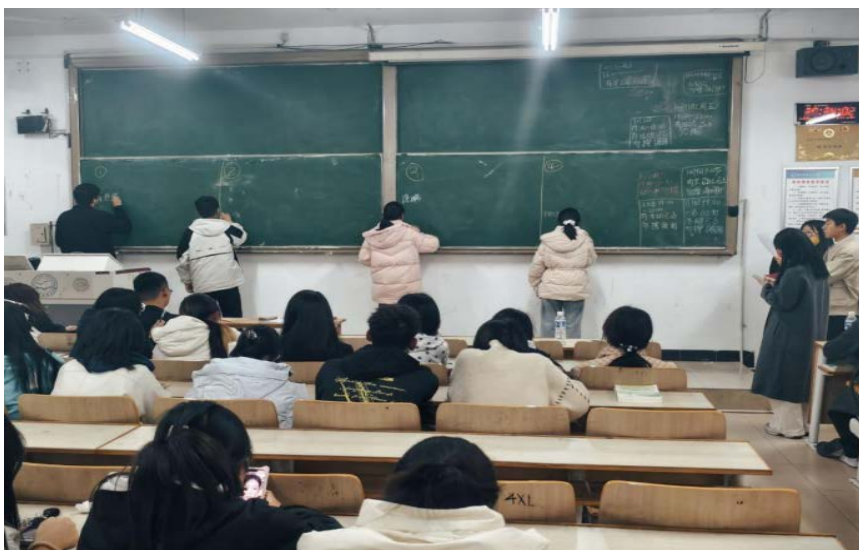
昌黎校区举办汉字听写大赛现场