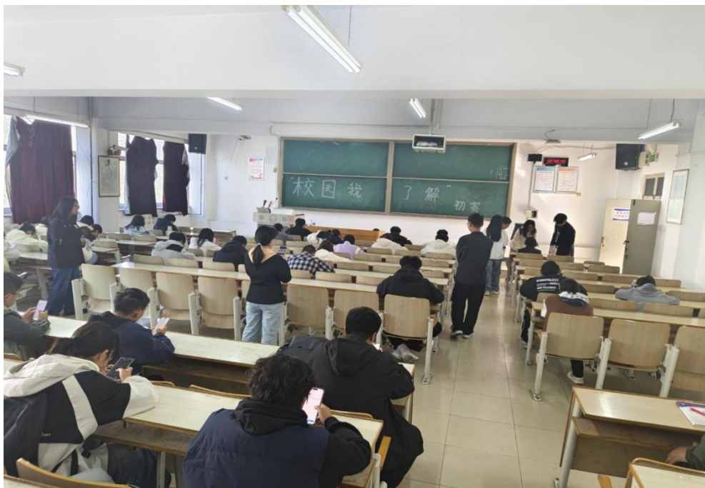
“校园我了解”知识竞赛答题现场