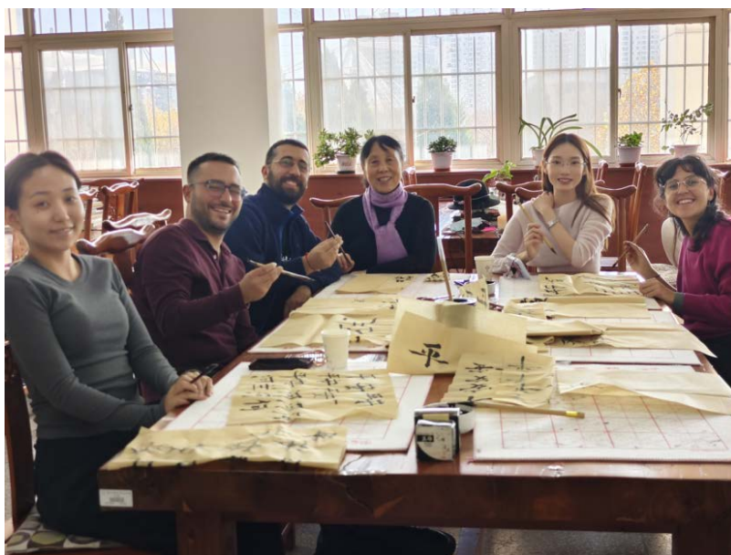
中外师生文化交流互鉴