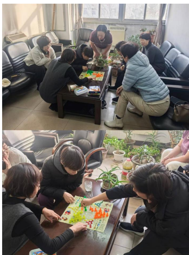
昌黎校区棋艺大比拼活动照片