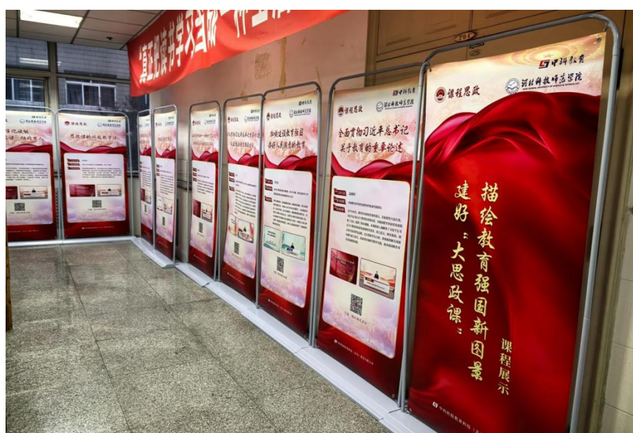
“大思政课”活动宣传展示

师生扫码即可收藏课程、不限次回看，实现常态化自主学习。此举打破课堂边界，以“以文化人、以文育人”的方式，引导师生厚植家国情怀，将个人理想融入国家发展，让“强国有我”的信念在校园落地生根。