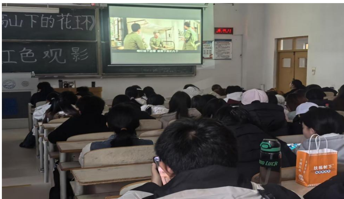
观看红色影片体会红色精神传承