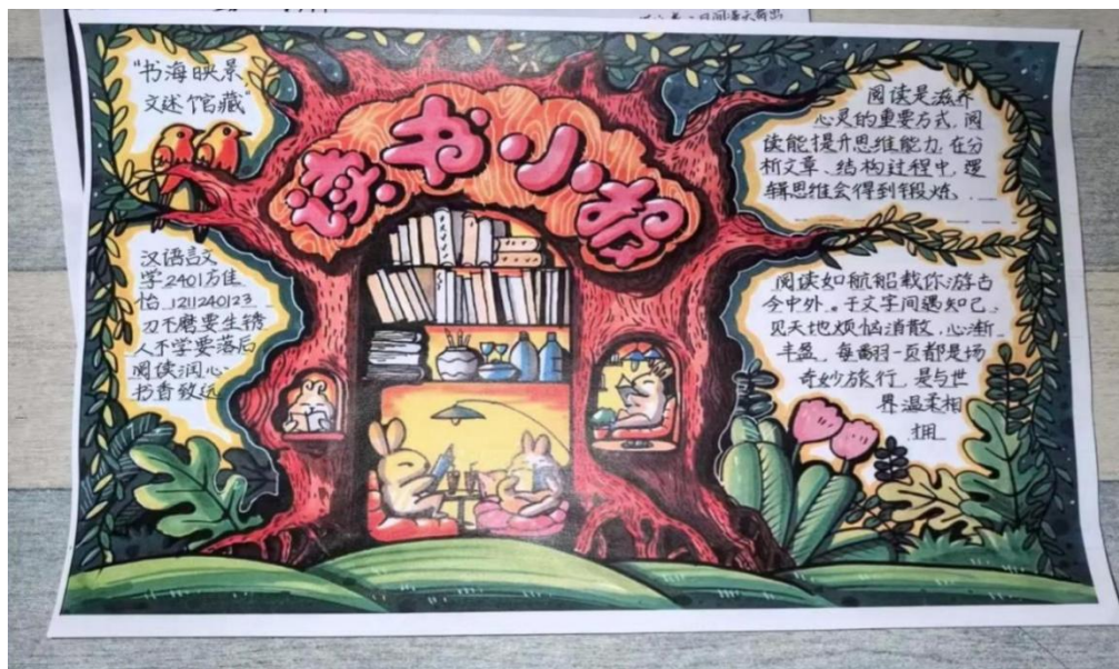
书海映景活动优秀作品展示

一幅生动的校园阅读精神图景。它不仅让图书馆的文献资源“活”起来，更让图书馆的物理空间升级为承载青春思考、沉淀文化底蕴的“精神容器”，让书香在文字传递中浸润更多心灵。