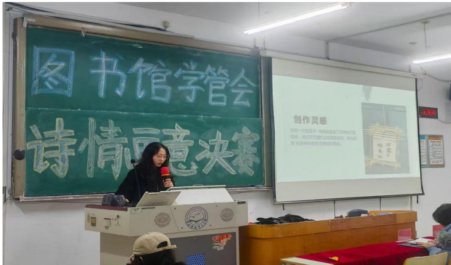
昌黎校区“诗情画意比赛”决赛现场