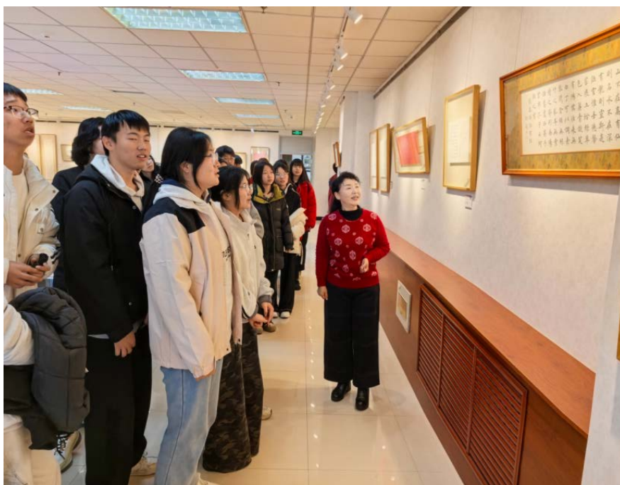
师生聆听讲解员老师讲解书法作品