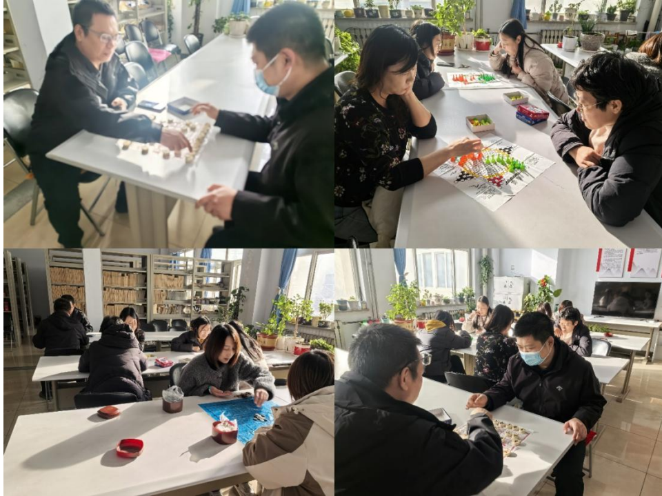
开发区校区棋艺大比拼活动照片