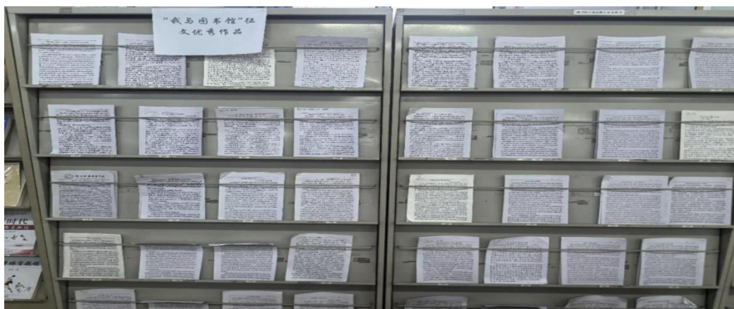
优秀作品在阅览空间展出