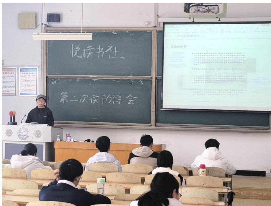
同学分享自己的读书感悟