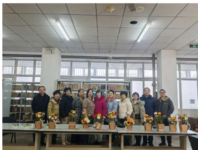
昌黎校区插花活动现场