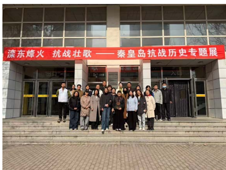
党员在抗战专题展横幅前合影留念

参观过程中，党员们认真聆听讲解、驻足凝视史料、交流感悟体会，深刻认识到中国共产党在抗日战争中发挥的中流砥柱作用以及和平的来之不易。参观结束后，党员们纷纷表示，将铭记历史、缅怀先烈，把伟大抗战精神转化为推动工作的强大动力，立足本职岗位，传承红色基因，优化文献信息资源，提升服务教学科研水平，以实际行动为学校高质量发展贡献力量。