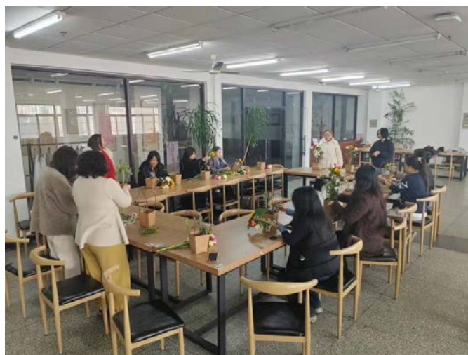
秦皇岛校区插花活动现场