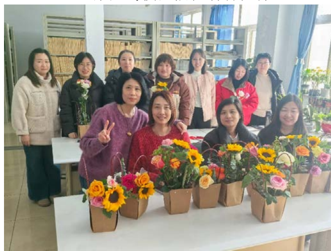
开发区校区插花活动现场