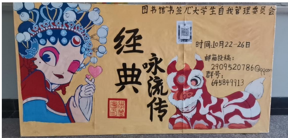
学管会自制的活动广告牌

中国传统文化不仅是中华文化中的瑰宝，也是世界文化中的瑰宝。希望以此此次活动为契机,让广大青年感受中华优秀传统文化的魅力，爱上中华传统文化，从古人的智慧中汲取营养，涵养心灵，“胸藏文墨怀若谷，腹有诗书气自华”。