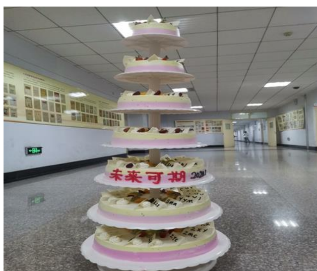
写有学管会成员名字缩写的蛋糕

这次素拓观影，让学管会全体成员之间增进了友情、深厚了感情，促进了组织团结、成员间互相了解和互相帮助。不忘初心，牢记使命，撸起袖子加油干，学管会全体成员将以更加昂扬的精神面貌和状态投入到工作中！