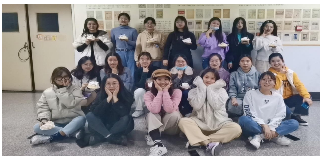
素拓观影现场二（学管会主席们在给大家分蛋糕）