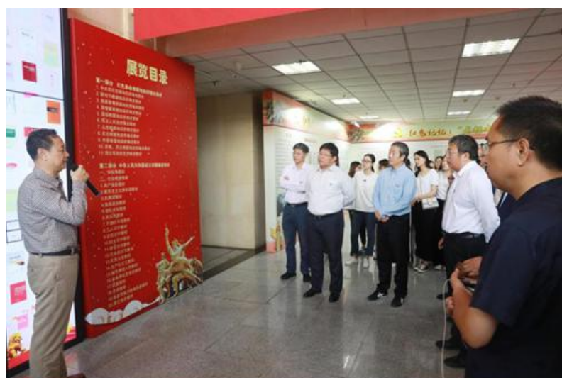
学校领导参观展览