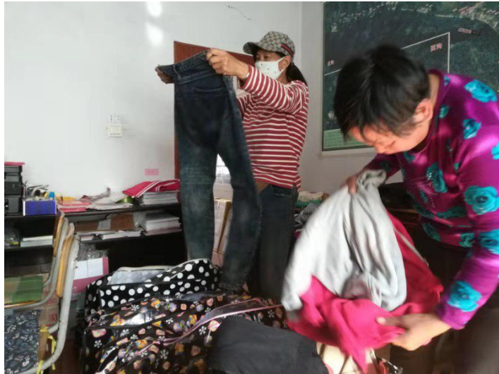
贫困群众正在接收捐赠的衣服