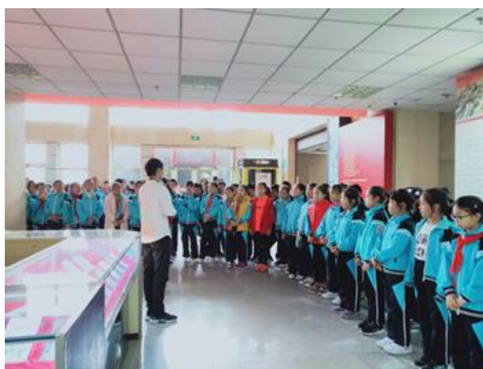
白塔岭小学学生参观展览