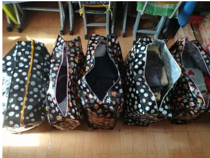
图书馆人捐赠的衣服

近日，随着脱贫攻坚工作的不断深入，图书馆领导班子在帮助贫困村“农民书屋”建设和替贫困户销售农产品的同时，又特别注重贫困户家庭生活环境和精神面貌的改善。当得知一些贫困户缺少衣物时，号召图书馆人开展了闲置衣物捐赠活动，并及时送到了困难群众手中。