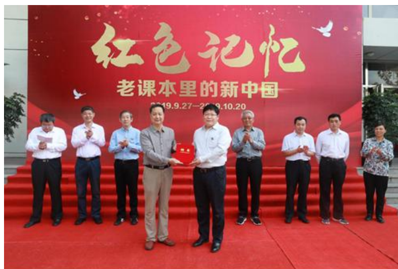
郭鸿湧为李保田颁发聘书

以磨灭的红色印记。欲知大道，必先知史。今天，我们通过红色教材，重温历史，以此激励我们传承红色基因，弘扬优良传统，凝聚磅礴力量，为实现中华民族伟大复兴的中国梦而努力奋斗！